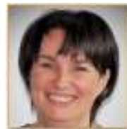
Greta Vandeputte Schepen van Gezin