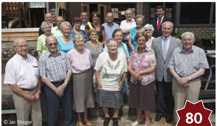
80-jarigen Sint-Eloois-Winkel