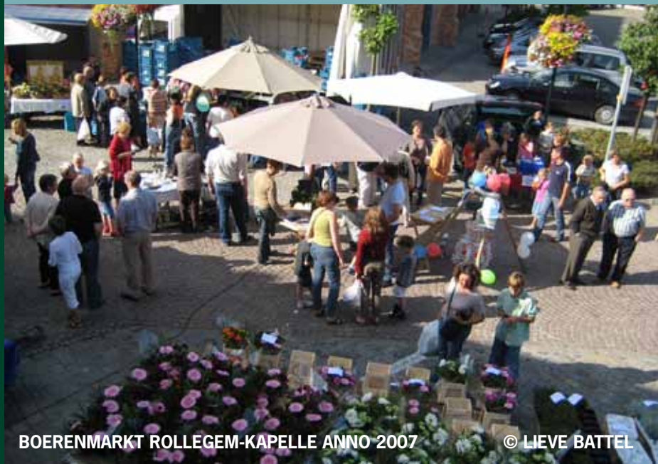
BOERENMARKT ROLLEGEM-KAPELLE ANNO 2007