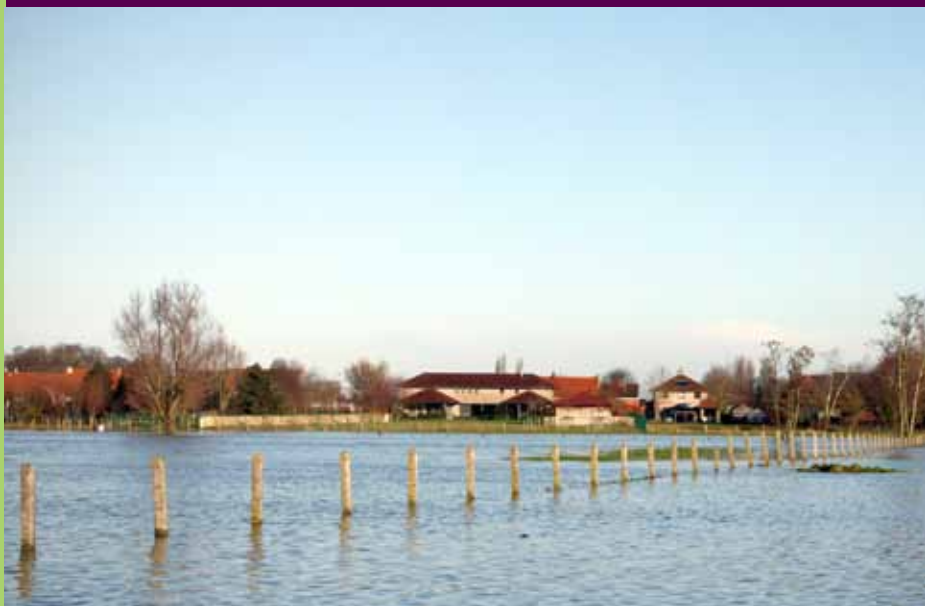
ZICHT OP HEMELHOEK VANUIT WEVELGEMSTRAAT