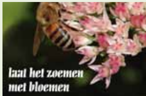
laat het zoemen met bloemen

Onze bijen stellen het vandaag niet zo goed. Ze zijn nochtans erg nuttig en een onmisbare schakel in de natuur. Denk maar aan de bestuiving. Eén van de problemen is het verdwijnen van bloemen met nectar in tuinen,